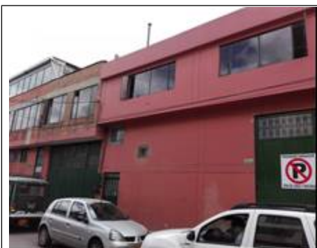
FOTOGRAFIA 1: FACHADA DEL PREDIO