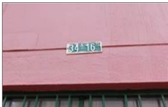
FOTOGRAFIA 2: PLACA DEL PREDIO