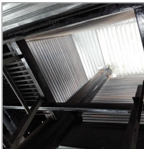
FOTOGRAFÍA 4. DUCTO DE LA CALDERA