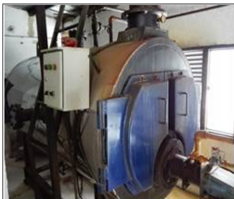
FOTOGRAFÍA 3. CALDERA BOILER DE 30BHP